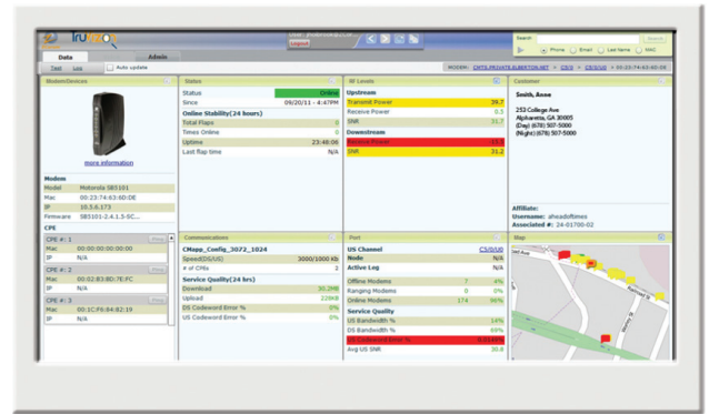
Interface fácil. Os dados são recebidos instantaneamente do modem DSL ou cabo, no momento em que eles são solicitados e são atualizados

1.800.909.9441 4501 North Point Parkway, Suite 125 Alpharetta, GA 30022 ZCorum.com | TruVizion.com Facebook.ZCorum.com | Twitter.com/ZCorum